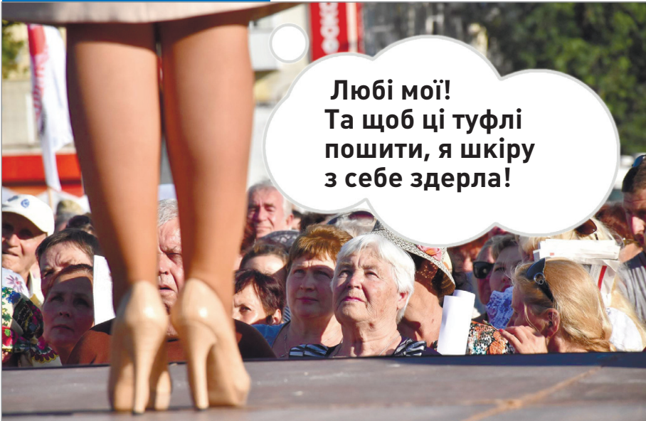
Лідер парламентської фракції БЮТ Юлія Тимошенко приїхала на зустріч з виборцями Херсона у туфлях із шкіри змії вартістю близько 2000 доларів, або понад 48 тис. грн. Це більше за суму пенсії середнього українського пенсіонера за 2,5 року.